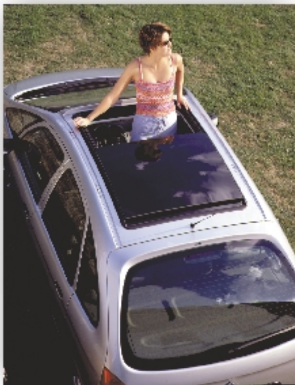
Hybridbauteile erobern das Auto.

In keiner anderen Branche folgen die Innovationsschübe so dicht aufeinander wie im Automobilbau; das betrifft die Werkstoffe nicht weniger als die Elektronik. Hybridbauteile vereinen die Vorteile verschiedener Werkstoffklassen in sich und können mehrere Funktionen zugleich erfüllen. Sie sind meist kompakter und kleiner als ihre konventionellen Vorgänger aber auch konstruktiv komplexer. Je nach Einsatzgebiet sinken die Rohstoff- und die Herstellkosten des Bauteils und es kann Gewicht eingespart werden.