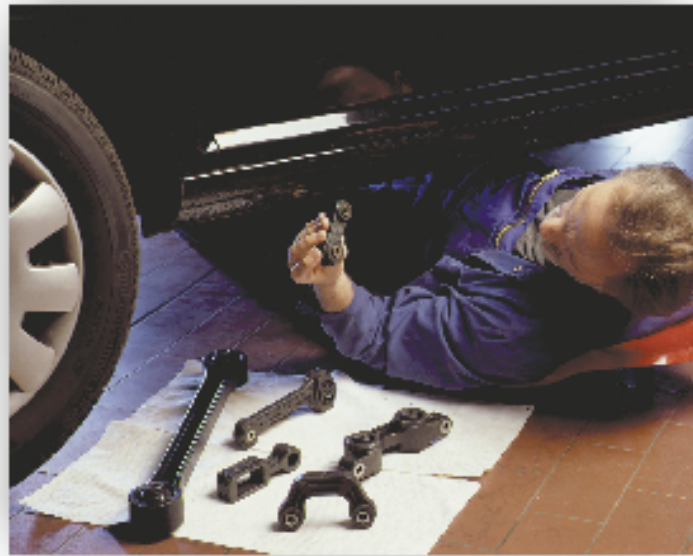
Fahrwerkklager sind ein weiteres Einsatzfeld für PA-Gummi-Konstruktionsverbunde.

Die unterschiedlichen Schwindungseigenschaften der verschiedenen Materialien im Konstruktionsverbund können während des Herstellungsprozesses einen Verzug verursachen. Um solche Deformationen zu vermeiden, ist es möglich, in die Form des Bauteils, aber auch in das Herstellverfahren einzugreifen. Bisher geschah die Verzugsoptimierung der Bauteile mit Hilfe von Simulationen an den einzelnen Komponenten des Produktes. Die BASF hat ein spezielles Simulationsverfahren entwickelt, mit dem ein Hybridbauteil als Ganzes auf Verzug analysiert werden kann. Diese Methode erlaubt es, zwischen verschiedenen Verbindungstechniken wie Verschrauben, Vernieten, Umspritzen oder Hinterspritzen zu unterscheiden. Auch die spezifischen Materialeigenschaften und ihre Abhängig-