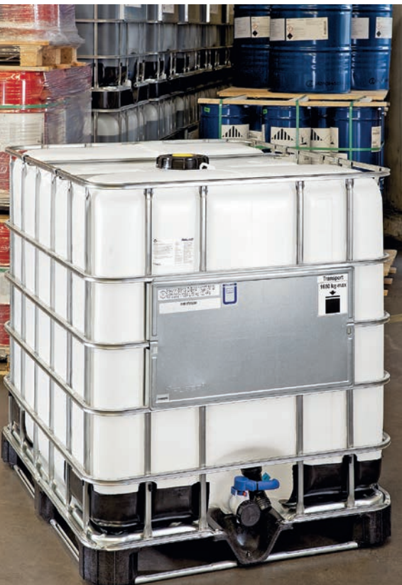
Eine mögliche Anwendung für das Additiv findet sich zum Beispiel in Intermediate-Bulk-Containern (IBC) für den industriellen Transport

fahren für den spezifischen Oberflächenwiderstand von festen, elektrisch isolierenden Werkstoffen.