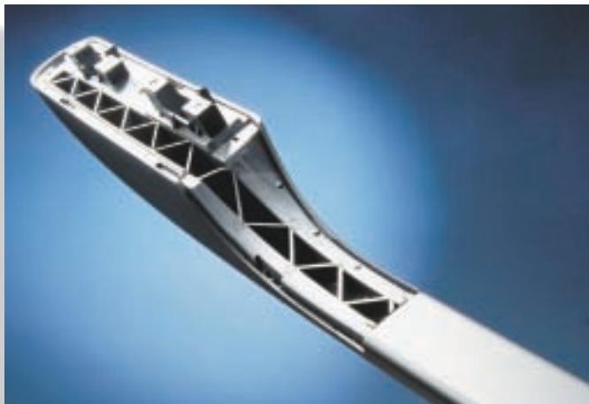
Bei Dachrelings hat sich eine Hybridbauweise aus kerb-unempfindlichen Metalleisten und hochfesten PBT-Füßen durchgesetzt.

Der Pkw Spiegelverstellantrieb MR4 von Magna Auteca besteht, bis auf die durchbrochene Halbschale (PPO), aus Ultraform N2320 003 schwarz. Der paten-