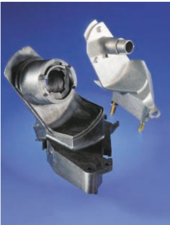
Die hohe Schlagzähigkeit von PBT führt zur vibrationsarmen Lagerung des Rückspiegels.

In Europa befinden sich etwa 50% aller Kunststoffanwendungen im Innenraum. Den zweitgrößten Anwendungsbereich stellen die spritzgegossenen Teile für Außenanwendungen mit ungefähr 22%. Hier kommen vornehmlich PP, PVC, ABS, PA, PUR, PC/ABS, PPE/PPO aber auch in zunehmendem Maß PBT und PET zum Einsatz. Insbesondere PBT erlaubt durch kurze Zykluszeiten und relativ niedrige Verarbeitungstemperaturen eine kostengünstige Massenproduktion wie in der Automobilindustrie gefordert.