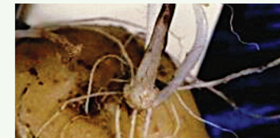
Muerte de brotes