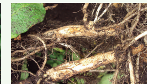
Cancro en raíces