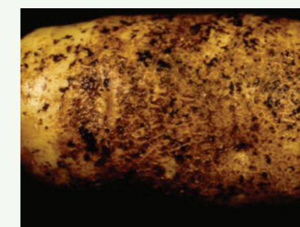
Sarna en red