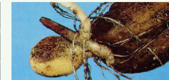
Muerte de brotes