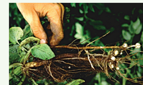
Cancros en base de tallos